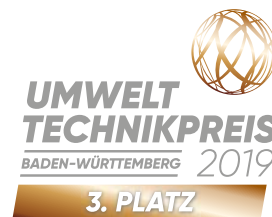
Label „Sieger“ 3. Platz