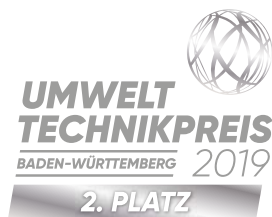
Label „Sieger“ 2. Platz