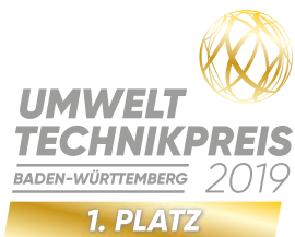
Label „Sieger“ 1. Platz